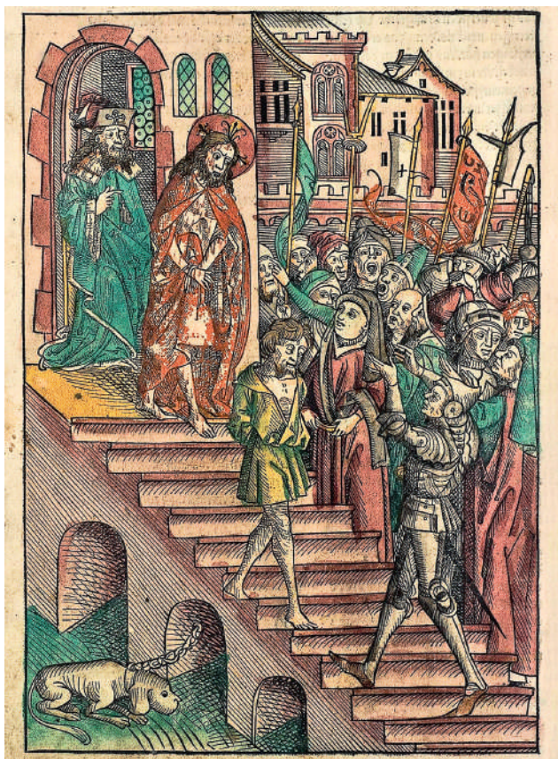
5. Михаэль Вольгемут. Се человек (гравюра из книги проповедей францисканца Стефана Фридолина, опубликованной в Нюрнберге в 1491 г.).

Darmstadt. Universitäts- und Landesbibliothek