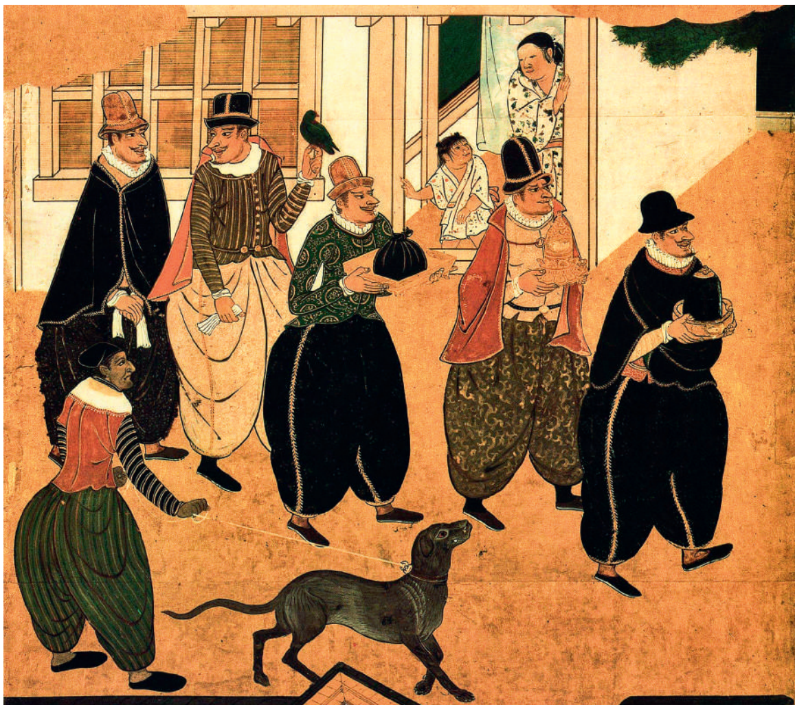
1. Португальцы высаживаются в Нагасаки в 1543 г. Фрагмент ширмы. Япония. Рубеж XVI–XVII вв.