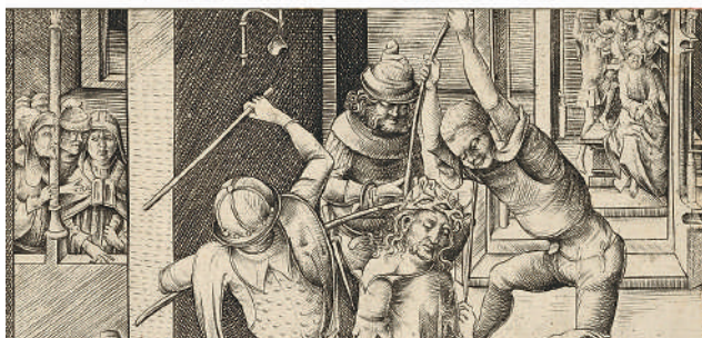
13. Вверху: Йос ван Клеве. Благовещение. Ок. 1525 г.

New York. The Metropolitan Museum of Art. № 32.100.60