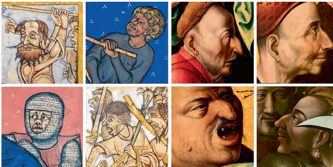
10. Лица истязателей Христа из Винчестерской псалтири (Англия. Ок. 1150 г.), Книги образов мадам Марии (Брабант или Геннегау. Ок. 1285 г.) и «Коронования терновым венцом», написанного анонимным последователем Иеронима Босха (Нидерланды. Ок. 1530–1540 гг.).

которые считались достойными визуализации, был сравнительно невелик. В сценах из Священной истории или житий святых, как правило, ограничивались несколькими ключевыми персонажами, а «декорации» были скупы и условны. Своим лаконизмом и иерархичностью многие образы напоминали схемы или, скорее, знаки событий. В эпоху готики пространство, в котором разворачивалось действие, стали изображать подробней и с большим правдоподобием. У многих художников и скульпторов проснулся интерес к реальному облику растений, животных и различных предметов — от воинской амуниции до городских укреплений 21 . Параллельно средневековые мастера стали осваивать новые экспрессивные средства в изображении человека. Плоские, угловатые и скованные тела постепенно ожили и приобрели объем. Лица, которые до того, как правило, были торже-