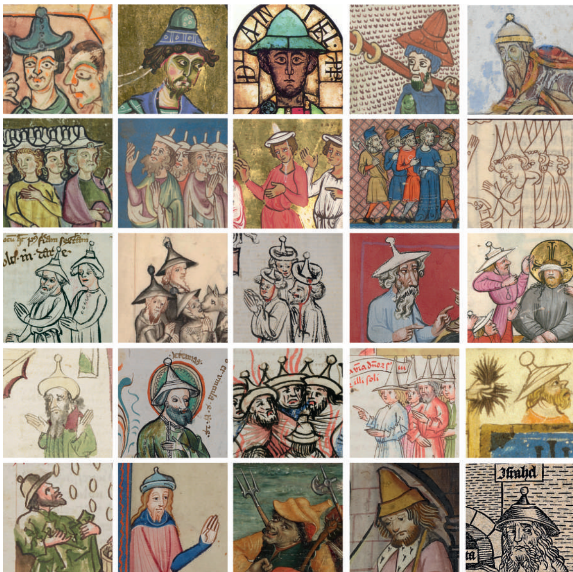
Г.1.2. Формы еврейских шапок в иконографии XI–XV вв.