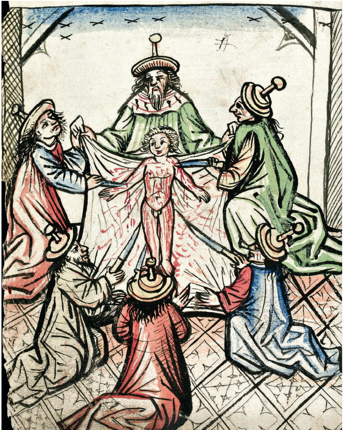
Г.г. «Констанцская хроника» Гебхарда Дахера. Констанц. 1472–1476 гг.

St. Gallen. Stiftsbibliothek. Cod. Sang. 646. P. 40av