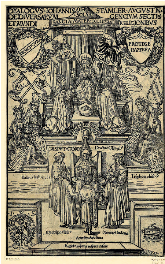
3. Титульный лист книги Иоганна Штамлера «Диалог о сектах различных народов и религиях мира» (Аугсбург. 1508 г.)

похожий на Юлия II (1503–1513), а по левую, под знаменем с двуглавым орлом, — император Священной Римской империи, в котором нетрудно узнать Максимилиана I (1508–1519). Церковь вручает папе ключи от Царства Небесного (Мф. 16:19) — символ его духовной власти и миссии по спасению душ, а государю — меч, напоминающий о его светской власти и обязанности охранять христианскую империю.