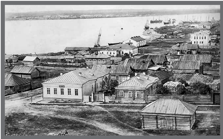
Город Онега. Фото нач. XX в.